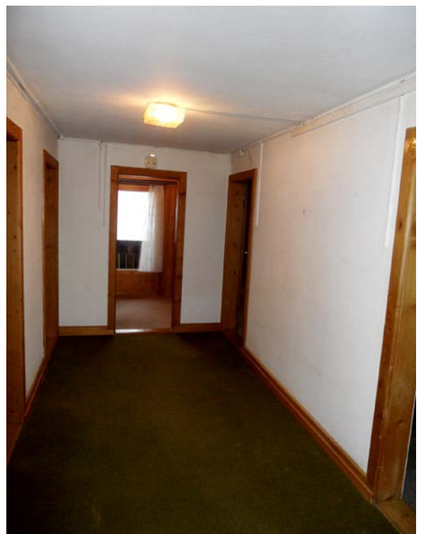
Korridor zum Balkon