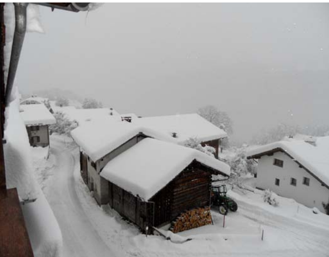
Das Haus liegt am Südhang mit fantastischem Blick auf den Piz Mundaun und nach Obersaxen.

Vor dem Haus ist die Posthaltestelle, die Sie direkt an den Skilift oder in die umliegenden Gemeinden bringt.